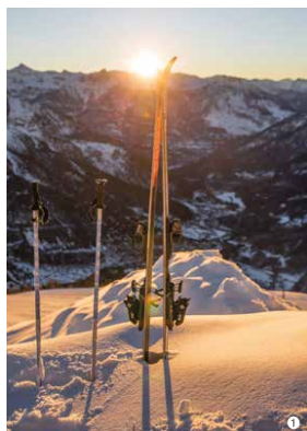
Skiez avant tout le monde ! Chaque dimanche, dès le 31 mars, Puy-Saint-Vincent ouvre ses pistes à 7h30. À Valberg, le petit-déj se prend au saut de la motoneige face aux sommets.